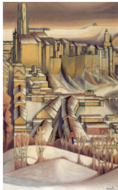
Cœur de la ville, 1950.

Etre peintre, dès les années trente, était en effet une gageure. Armand Niquille avait tellement peu de moyens qu'il employait des cartons ou des pavatex car il ne pouvait s'offrir des toiles. Il choisissait la tempera qu'il glaçait par la suite, la peinture à l'huile pour ses grandes compositions étant trop chère. Il effectuait, parallèlement à ses activités artistiques (mot qu'il redoutait d'ailleurs, préférant se décrire lui-même comme un humble artisan), des tâches pour survivre: ainsi avons-nous trouvé dans ses affaires un carnet de l'époque avec en-tête «Niquille, denrées coloniales», ce qui ne va pas sans nous faire penser à Rimbaud. Armand transportait en effet des balluchons pour les commerçants locaux. Ce terme «denrées coloniales» nous laisse songeurs, sachant que l'artiste fut essentiellement un voyageur immobile, ayant pour compagnon la solitude de son atelier et les chemins de l'esprit. Einstein lui-même n'a-t-il toutefois pas dit que «l'imagination vaut mieux que la connaissance»?