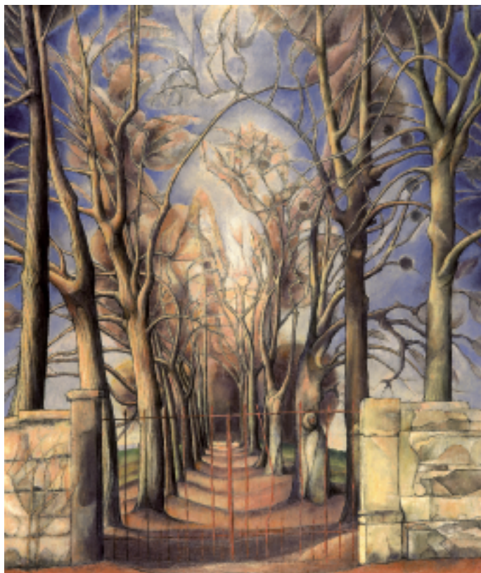
La grande allée, 1982.