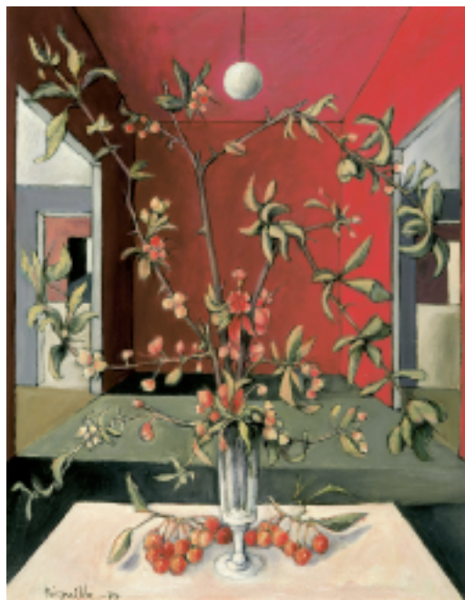
Table printanière, 1974.