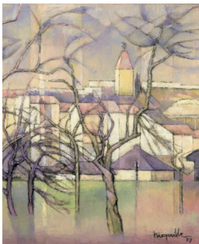
Le jardin détail, 1978.