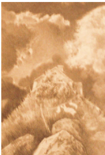
Alphonse Probst: Hängende Wäsche. Bleistift.