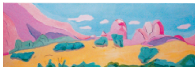
Philipp Lyrer: Amerikanische Landschaft I-III (v. o. n. u.). Acryl.