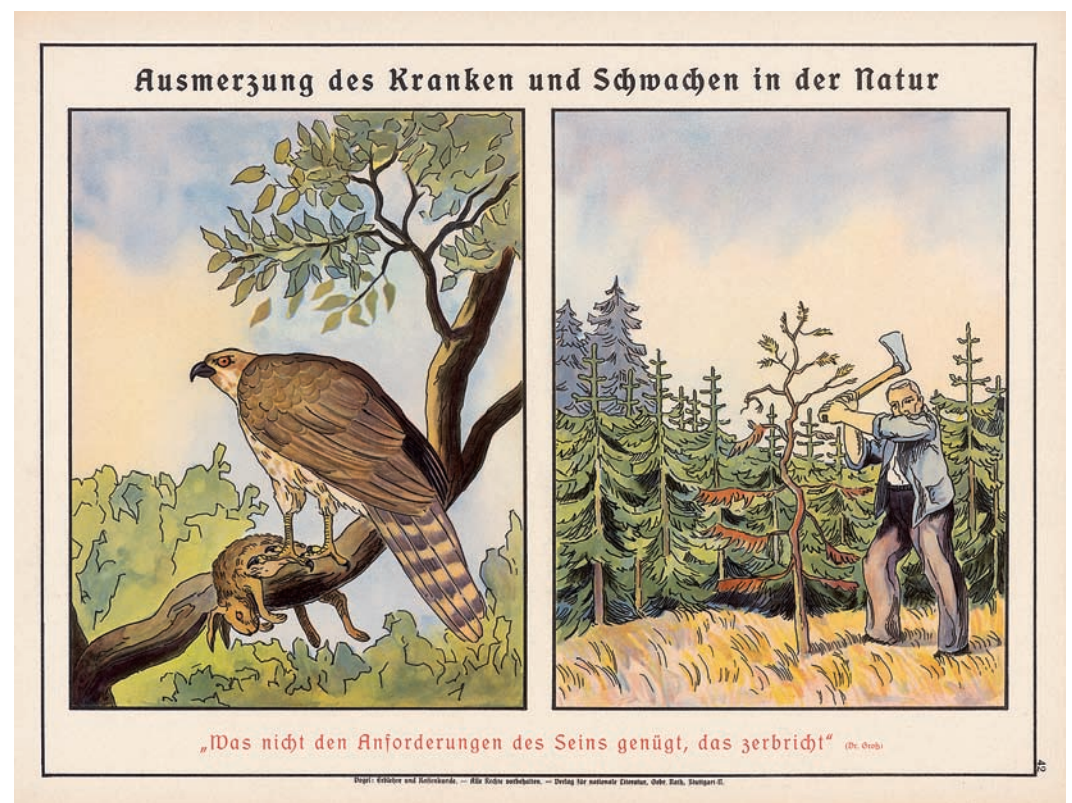
«Ausmerzung des Kranken und Schwachen in der Natur». Lehrtafel aus «Erblehre, Abstammungs- und Rassenkunde in bildlicher Darstellung» von Alfred Vogel, 1938.

mit dem Titel «Tödliche Medizin» bot in Dresden bis Ende Juni 2007 eine unverzichtbare Gelegenheit, das böse Thema zu vertiefen. Einzigartig wegen der Fülle an ausgestellten Dokumenten, bemerkenswert aber auch wegen der Absicht einer kritischen Auseinandersetzung mit aktuellen Utopien einer biologischen Verbesserung des Menschen. Schritt für Schritt wurde der lange Weg bis hin zur nationalsozialistischen «Endlösung» nachgezeichnet. Den Ausdruck «Eugenik» prägte der britische Wissenschaftler Francis Galton (1822–1911), ein Vetter von Charles Darwin: «[...] what a galaxy of genius might we not create!» Seine Ansichten der Zuchtwahl waren international weit verbreitet, erinnert sei an den Schweizer Psychiater Auguste Forel (1848–1931), der sich erfolgreich für die Zwangssterilisation einsetzte. Forscher wie der Kriminalist Cesare Lombroso in Italien entwickelten eine Anthropologie unwerten Lebens, die zu Sterilisationsgesetzen in den USA, Kanada und der Schweiz führte. Schon lange vor dem Dritten