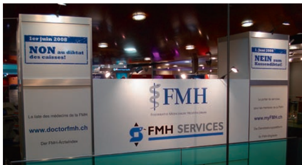
La FMH et FMH Services annoncent la couleur

La forme de l'atelier ayant rencontré un écho extrêmement positif, la prochaine rencontre fixée au 27 août aura également lieu sous cette forme; elle aura pour thème les «relations avec les médias»: quel est le quotidien d'une rédaction? A quoi faut-il veiller pour qu'un communiqué de presse soit pris en considération et ne finisse pas dans la corbeille à papier? Quand et quelles relations sont-elles appropriées? Les expériences des participants joueront à nouveau un grand rôle. Cette prochaine rencontre promet d'être passionnante et utile tout à la fois!