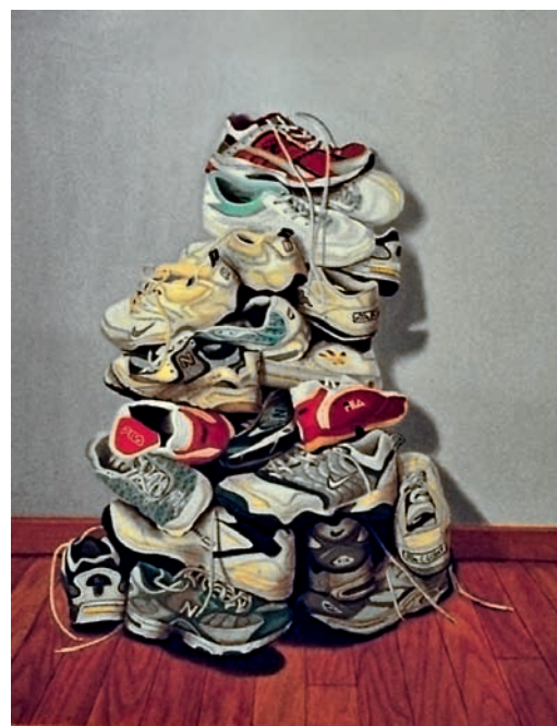
Catherine Gobat: Cairn, huile sur toile