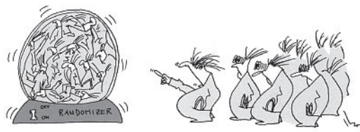
In a couple of minutes we can start the study ... the patients will be perfectly randomized ...