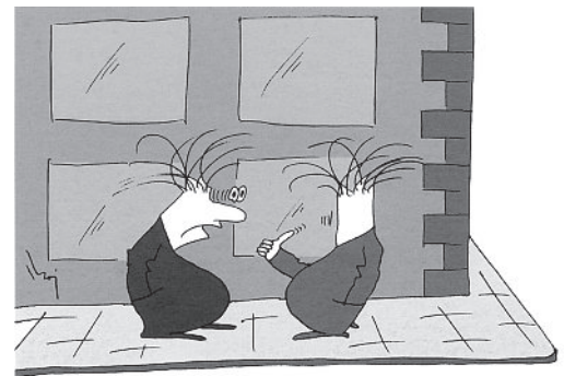
My dermatologist said that my face will come back as soon as the botox over-correction has worn off ...