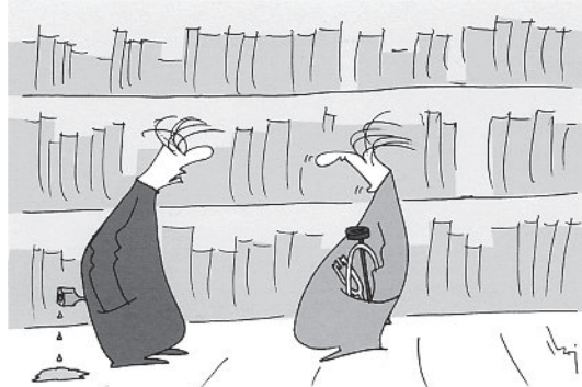
Headaches after lumbar puncture disappear spontaneously after a couple of days ...