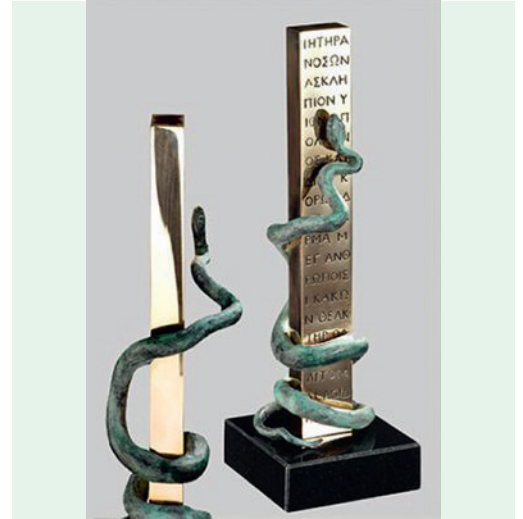
Der Äskulapstab, das Weltsymbol zwischen Moses, Michelangelo und griechischer Antike, aus Bronze auf Granit, 9x9x27cm gross.