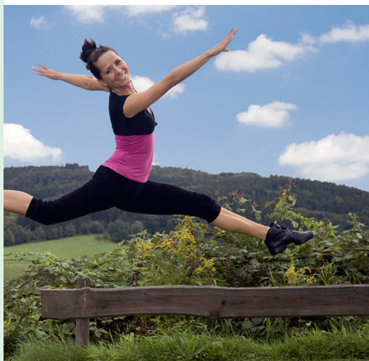
YOURMOVE: Créer des slogans qui font bouger.

Promotion Santé Suisse lance YOURMOVE, le premier concours participatif et 100% web 2.0 à destination du jeune public (15 à 30 ans). YOURMOVE ( www.yourmove.ch ) leur donne la parole et les invite à créer des slogans qui font bouger. Le concours récompensera les deux Romands les plus créatifs par un snowboard personnalisé, gravé en direct à partir des meilleurs slogans. Le concours est ouvert du 21 octobre au 30 novembre 2009. Il demande aux internautes d'inventer un slogan à partir de cinq clips vidéo ou de cinq images sur l'activité physique. Plutôt que de sensibiliser avec des messages culpabilisants, Promotion Santé Suisse a choisi la voie participative pour faire passer son message sur la nécessité de pratiquer des activités physiques régulières pour jouir d'une bonne santé.