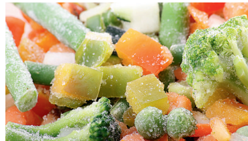
Hoher ernährungsphysiologischer Wert: Tiefgekühltes Gemüse.