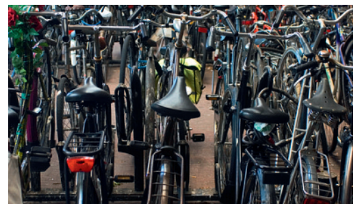
An einer Velobörse in Ihrer Nähe.