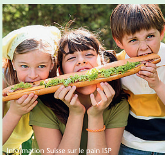
Information Suisse sur le pain ISP