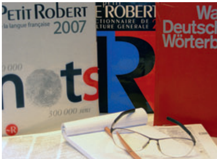
Petit Robert, Larousse, Duden – les outils de travail des traductrices et traducteurs.

Ces réactions sont certes encourageantes, mais les démarches ne couvrent pas toutes les questions importantes soulevées dans le concept de la FMH. En outre, il n'est absolument pas certain que la recherche concomitante puisse commencer début 2011. Or, cela serait nécessaire pour qu'on puisse comparer la situation avant et après l'introduction de SwissDRG et détecter suffisamment tôt les éventuels incitatifs erronés du système de forfaits par cas.