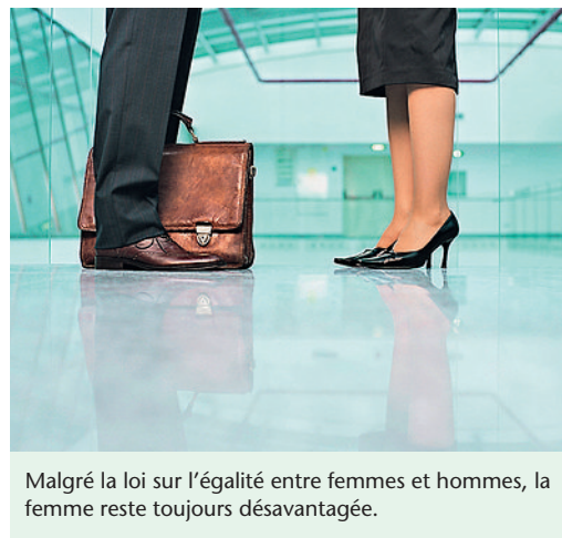
Malgré la loi sur l'égalité entre femmes et hommes, la femme reste toujours désavantagée.

Transfair, le syndicat du service public, s'engage pour l'égalité entre femmes et hommes: le syndicat a soutenu la journée de l'égalité des salaires du 11 mars 2010, et constate avec déception que la femme reste toujours désavantagée, malgré la loi sur l'égalité entre femmes et hommes. A travail égal et à conditions égales, les femmes gagnent en moyenne 20% de moins que les hommes. transfair exige, et pas uniquement pour cette seule journée: à travail égal – salaire égal, la promotion de la représentation des femmes dans des postes de cadre et des possibilités de conciliation entre travail et famille. En plus, transfair s'engage dans des négociations avec les partenaires sociaux des entreprises du service public.