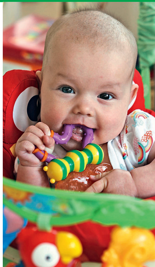
Endokrin wirksame Chemikalien in Kinderspielzeug gelten als besondere Gefährdung.