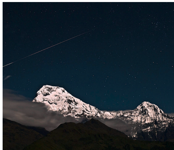
Wünsche schwerkranker Kinder erfüllen – die Stiftung «Sternschnuppe» macht es möglich.