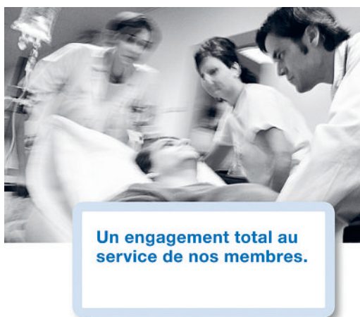
Coup d'œil sur la nouvelle brochure présentant les nombreux avantages d'une affiliation à la FMH.

Connaissez-vous les nombreuses prestations offertes par la FMH à ses membres? Ou n'êtes-vous pas encore affilié-e à la Fédération des médecins suisses et vous vous demandez quels sont les avantages d'une affiliation? Le service de la communication de la FMH a réuni avec les autres services spécialisés les arguments les plus importants pour lesquels il vaut la peine d'être membre de la FMH. Il a maintenant publié une brochure intéressante présentant de manière claire et précise les avantages de l'affiliation à la FMH. Pour ne citer que quelques exemples: