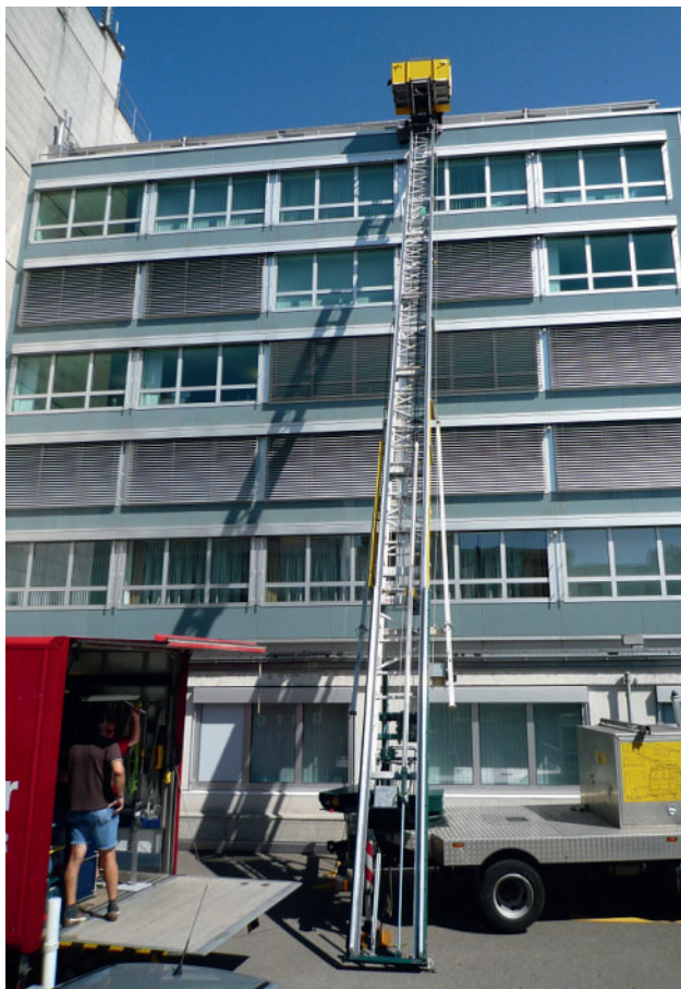
Grue avec ascenseur pour le transport des cartons au 6 e étage...