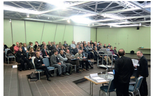
Exposés et ateliers: le programme de la journée était diversifié et passionnant

et futures sont publiées dans le Bulletin des médecins suisses ainsi que sur www.fmh.ch → TARIFS → TARMED Tarif → Publications → Journées des délégués tarifaires.