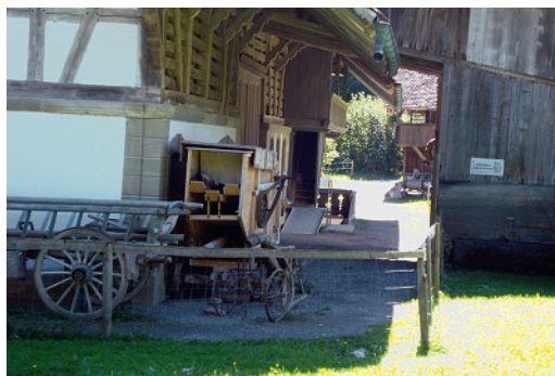
Aperçu de la vie rurale d'antan

La sortie annuelle du Secrétariat général de la FMH est une belle tradition qui permet