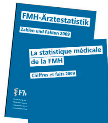
Chiffres et faits – la nouvelle statistique médicale 2010 sera publiée en mars

projets émanant des cabinets médicaux et des cliniques ou des entreprises actives dans le domaine de la santé. Depuis cette année, le Swiss Quality Award est décerné conjointement par la FMH, l'Institut de recherche évaluative (IEFM) de l'Université de Berne et la Société Suisse pour le Management de Qualité dans la Santé (SQMH). La philosophie reste toutefois la