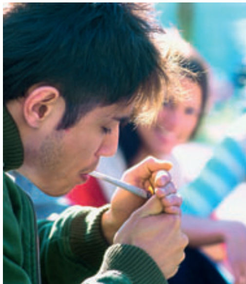
Il existe une corrélation entre troubles psychiques et consommation de cannabis.