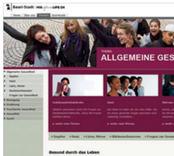
So sieht die neue Homepage mit Gesundheitsthemen speziell für Jugendliche aus.