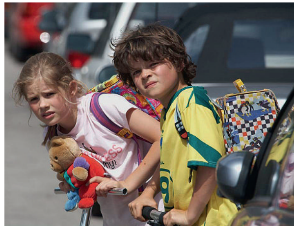
Schulwege sollen sicher gemacht werden. Im Tessin können hierfür jetzt Gelder des interkantonalen Lotteriefonds eingesetzt werden.