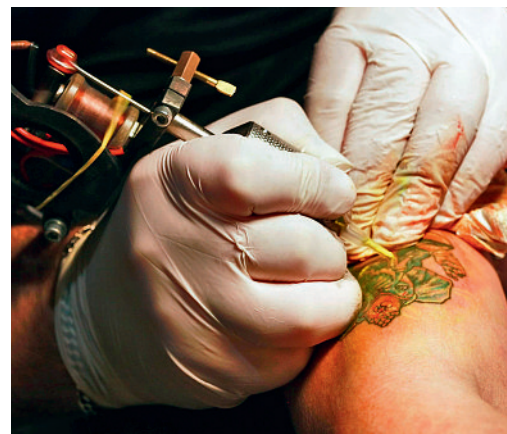
Die Farben von Tattoos lagern sich nicht nur unter der Haut ab, sondern auch in den Lymphknoten.