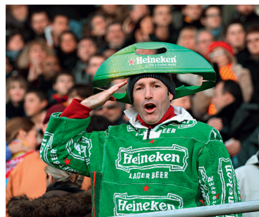
Addiction Info Suisse demande l'interdiction du sponsoring lors des manifestations sportives.

La publicité en faveur de la bière est omniprésente lors des matches de football et de hockey sur glace. En Suisse, l'argent du sponsoring se déverse essentiellement vers le sport. Chaque année, ce montant atteint au moins 500 millions de francs. Une étude récente d'Addiction Info Suisse montre que le sport est un vecteur de sponsoring très important pour l'industrie de l'alcool. L'objectif du sponsoring sportif est d'attirer une nouvelle clientèle consommatrice d'alcool. Le secteur de la bière est particulièrement actif dans ce domaine. Addiction Info Suisse considère qu'il est problématique que l'industrie de la bière finance des sports que les jeunes suivent dans les médias ou dans les stades et qu'ils pratiquent activement. Pour cette raison, elle demande l'interdiction du sponsoring lors des manifestations sportives.