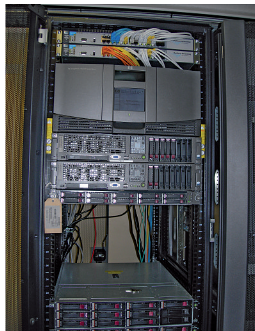
Diminution de la consommation d'énergie: la FMH est passée d'une gestion physique à une gestion virtuelle de ses 20 serveurs

La réception de cette lettre nous a particulièrement réjoui: Energie Wasser Bern (ewb), notre fournisseur d'électricité, nous crédite un «Bonus pour économie de courant» pour nous remercier d'avoir économisé 2,6% de courant en 2010. Voici comment nous y sommes parvenus: nous avons commencé par analyser la consommation d'énergie du Secrétariat général de la FMH. A l'aide d'un conseiller d'ewb, nous avons recherché les appareils gourmands en énergie et défini des mesures pour améliorer la situation. Nous en avons déjà mises en œuvre quelques-unes – avec succès, comme nous avons pu le constater. L'économie de courant réalisée vient principalement de notre passage à la gestion virtuelle de nos serveurs informatiques: à la place de 20 serveurs physiques, nos applications fonctionnent maintenant sur seulement six serveurs! Mais de nombreux petits gestes permettent également d'économiser du courant: éteindre complètement les ordinateurs, les imprimantes et les écrans avant de rentrer chez soi, éteindre la lumière dès qu'elle n'est plus nécessaire, utiliser si possible des ampoules halogènes économiques, installer un éclairage de plafond économique au lieu de lampes de bureau halogènes gourmandes en énergie, désactiver plus rapidement la lumière extérieure et celle du garage. Bref, nous avons fait un premier pas en avant, mais il reste encore beaucoup à faire: continuons sur cette voie!