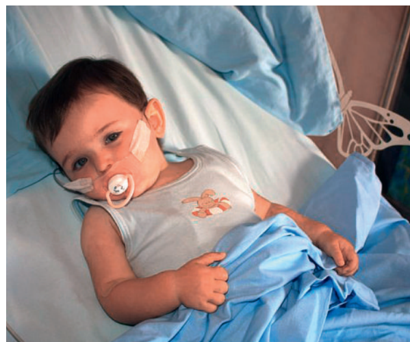
Eine Studie hat untersucht, wie sich Kinder nach erfolgreichen Herzoperationen weiterentwickeln.