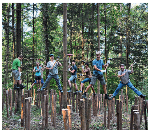
Auch ein Labyrinth – hier in der Entstehung – ist Bestandteil des Basler Klimawegs.

Anfang September wurde der Basler Klimaweg eingeweiht. Er führt über 17 Stationen vom Friedhof Hörnli in Riehen bis auf die Chrischona