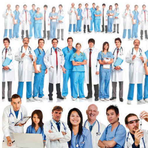
Mehr Ärzte für die Schweiz: Eine Erhöhung auf insgesamt 1100 Studienabschlüsse soll es möglich machen.

Ab dem Jahr 2018/19 sollen jährlich rund 300 Ärztinnen und Ärzte zusätzlich ausgebildet werden. Dies hat der Dialog Nationale Gesundheitspolitik von Bund und Kantonen aufgrund eines vom Bundesamt für Gesundheit (BAG) und von der Schweizerischen Universitätskonferenz erarbeiteten Berichts als Massnahme gegen den Ärztemangel beschlossen. Damit befürwortet er die Erhöhung auf insgesamt 1100 Studienabschlüsse an den fünf medizinischen Fakultäten der Schweiz. Die anfallenden Mehrkosten von mindestens 56 Millionen jährlich könnte der Bund decken, indem er einen zusätzlichen Teil seiner Grundbeiträge an die Universitäten dafür einsetzt. Die genaue Finanzierungsart steht aber noch nicht fest und soll genauso wie die Frage des Standorts der Ausbildungen weiter abgeklärt werden. Es geht darum, ob und unter welchen Bedingungen die Einrichtung neuer Fakultäten geeignet wäre.