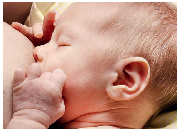
L'allaitement maternel présente des avantages essentiels pour la santé de la mère et de l'enfant.