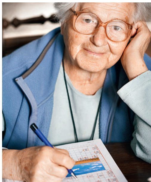
Auch wenn es vielleicht nicht so viel nützt wie gedacht, Spass macht es trotzdem.