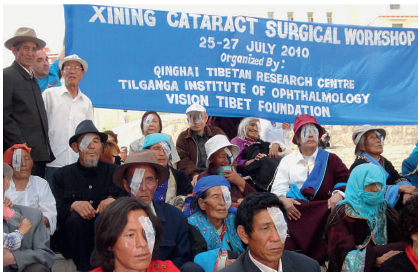
Behandlung des grauen Stars in einem Operationscamp in Xining, Region Amdo, Juli 2010, © Tibet Vision.