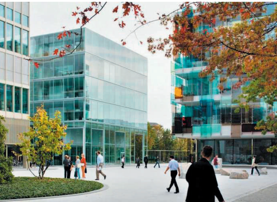
Einige der imponierenden Gebäude des Basler Novartis-Campus, wo Ende Januar die Science Night stattfand.