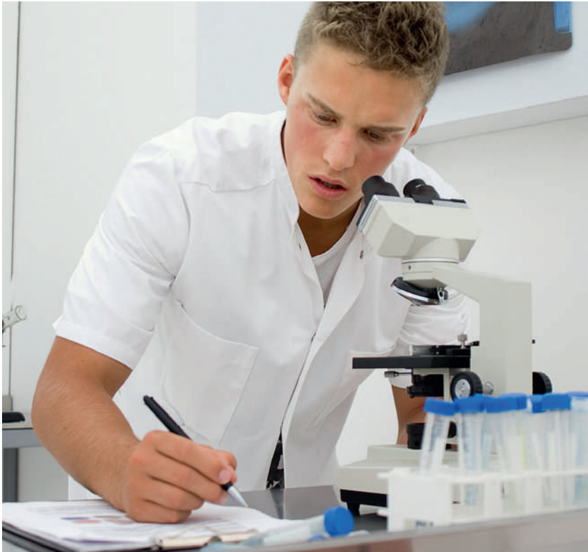
Was tun, wenn die Daten nicht passen – den «Ausrutscher» einfach weglassen?

worden. «Ich persönlich würde dies jedoch zumindest stark an der Grenze zum Wissenschaftsbetrug ansiedeln», sagte Jüni. Tausende von Ärzten und Patienten wurden an der Nase herumgeführt, und der Hersteller hat Milliarden verdient.