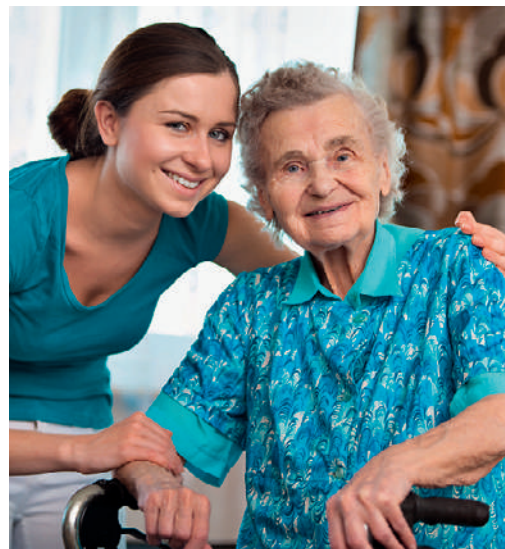
Caritas Schweiz vermittelt zu fairen Bedingungen Migrantinnen für eine Betreuung zu Hause.