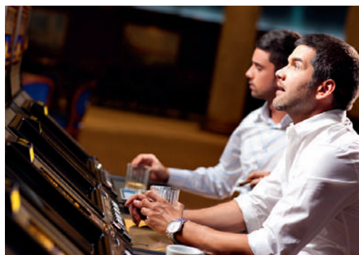
Studien haben Erkenntnisse geliefert, wie man der Spielsucht vorbeugen kann.

In der Schweiz spielen zwischen 80 000 und 120 000 Menschen auf problematische Weise