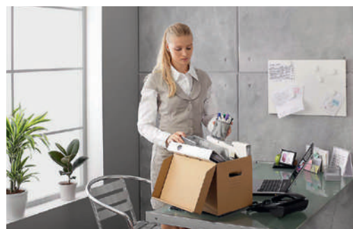
Menschen ohne Arbeitsstelle leiden länger an Depressionen als Berufstätige.

Leichte Depressivität ist in der Schweiz weitverbreitet und aufgrund der Folgewirkungen nicht zu unterschätzen. Zu diesem Ergebnis kommt