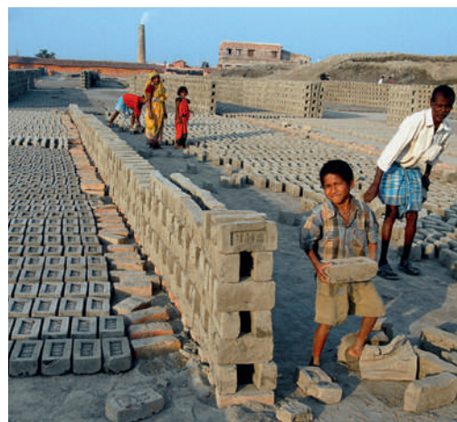
Environ 150 millions d'enfants âgés de 5 à 14 ans sont contraints de travailler pour aider leur famille.