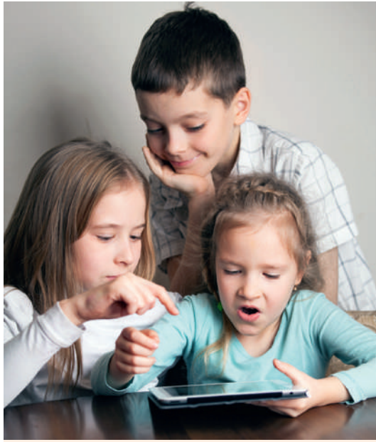
Ont-ils vu veau, vache, cochon ou couvée?

A propos de l'accumulation de données personnelles par des intervenants divers et multiples, thème devenu banal mais pas moins inquiétant: «Petite Poucette – individu, client, citoyen – laissera-t-elle l'Etat, les banques, les grands magasins... s'approprier ses données propres, d'autant qu'elles deviennent une source de richesse. Il peut en résulter un regroupement des partages socio-politiques par l'avènement d'un cinquième pouvoir , celui des données».