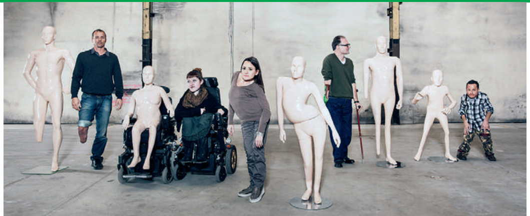
Ganz besondere Schaufensterpuppen für die Zürcher Bahnhofstrasse: Figuren mit Skoliose oder Glasknochenkrankheit.