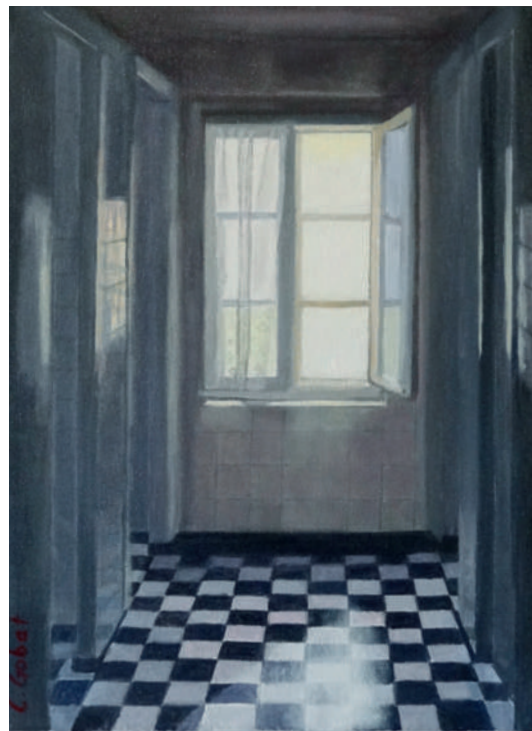
Catherine Gobat, «Lieux communs», huile sur toile.

dass abschliessend gesagt werden kann: Das, was uns im Medizinalbereich Tätige zur bildenden Kunst antreibt, wird verstanden und auch bewundert.