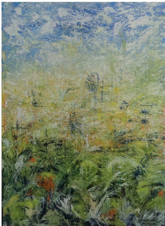
Harriet Keller-Wossidlo, «Wiese im Spätsommer», Acryl auf Leinwand gespachtelt.