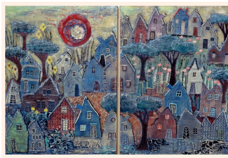
Oben: Philippe Lyrer, Landschaft auf einer Mittelmeerinsel I, Öl auf Leinwand.