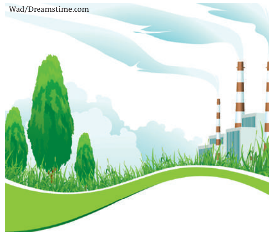
CO 2 lässt die Pollenproduktion von Gräsern steigen.