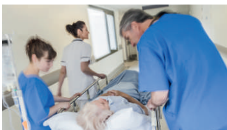
Nur jeder dritte Arzt denkt, dass er zur Einschätzung der Urteilsfähigkeit von Patienten genügend kompetent ist.