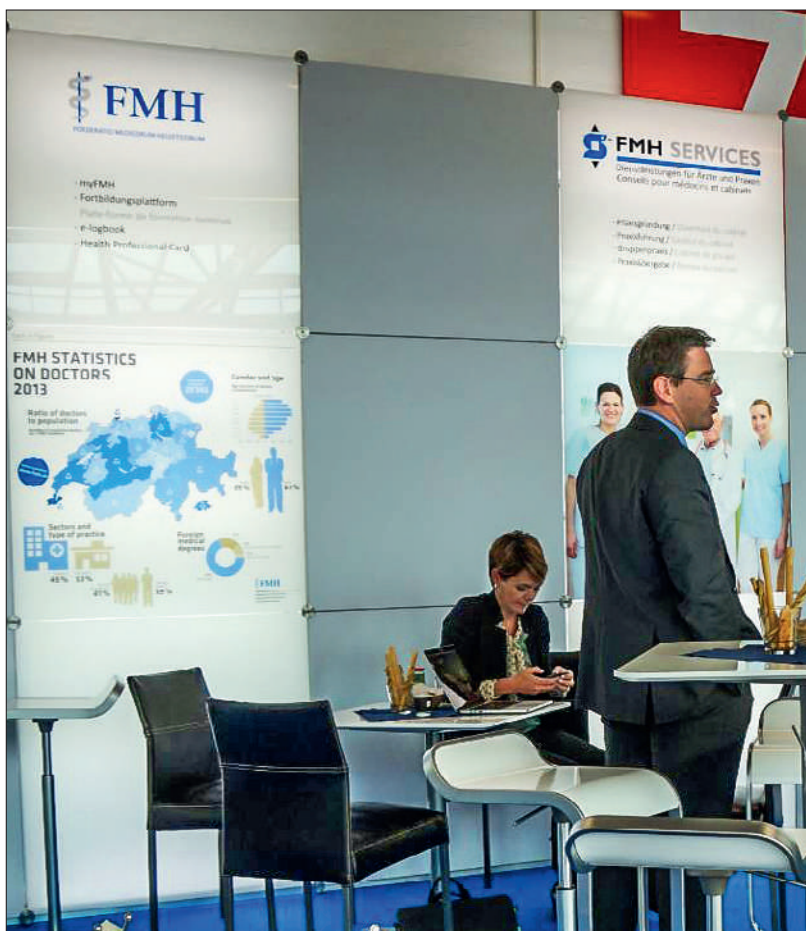
Informations concernant la formation postgraduée, les publications médicales, l'ouverture d'un cabinet, et bien plus encore, lors de l'Assemblée annuelle de la SSMI à Bâle.