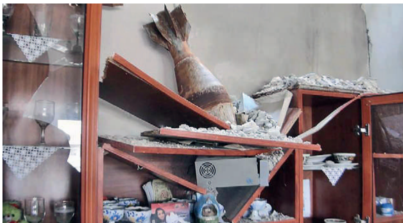
Alltag in Kobanê.

lassene Sprengfallen. Kurz vor unserer Rückreise nach Diyarbakir besuchen wir im Spital in Suruç den Spitalverwalter aus Kobanê. Er war dort durch eine herunterstürzende Decke schwer verletzt worden. Ein weiteres grosses Problem sind die vielen toten IS-Kämpfer, die noch unter den Trümmern vor allem im Osten der Stadt liegen.