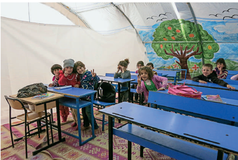
«Victory» – das Zeichen der Kämpfer – schon die Kinder kennen es, doch nicht alle schaffen es zu lächeln.