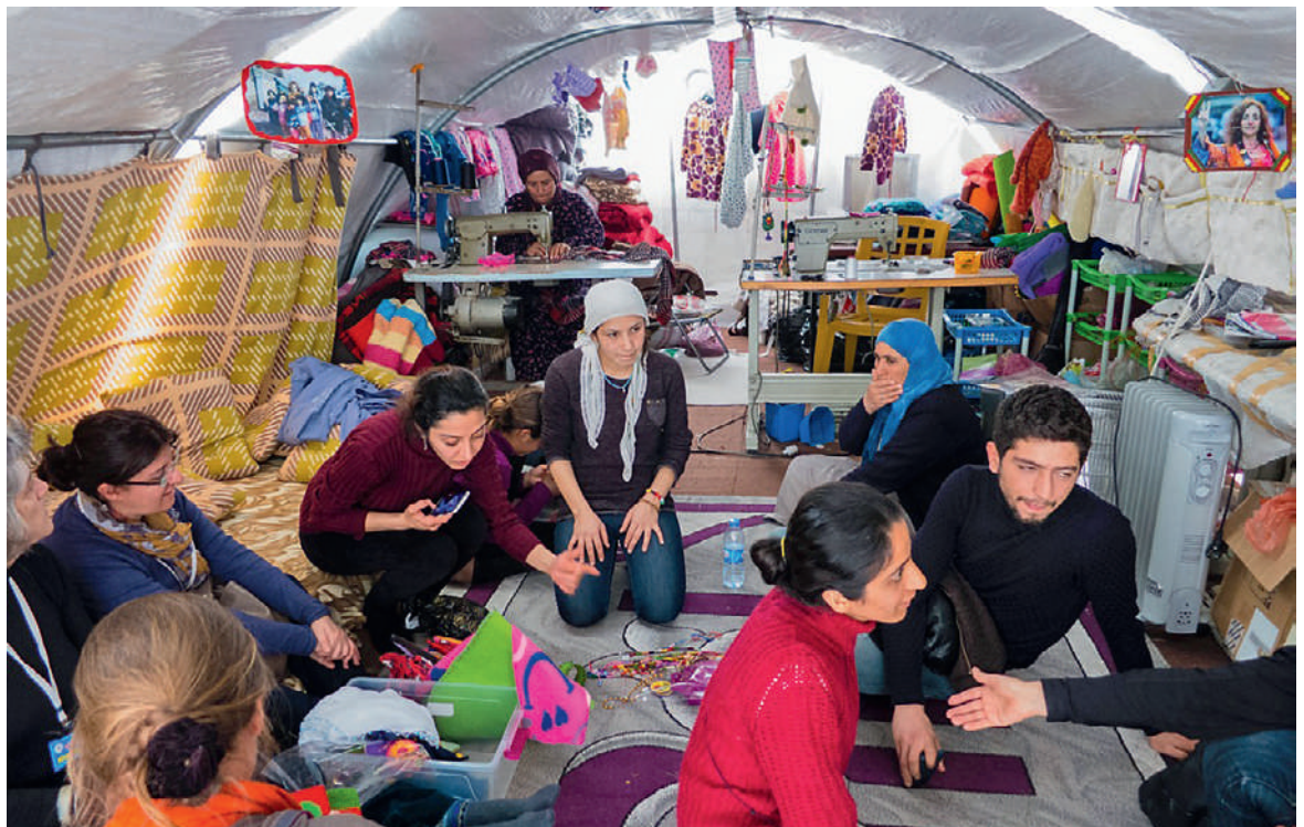
Endlich etwas Freude im Nähatelier des Flüchtlingslagers von Suruç an der türkisch-syrischen Grenze: In Kobanê wurde ein Sieg über den IS erkämpft.

Wir sind drei Ärztinnen, eine Körpertherapeutin mit Arabischkenntnissen und unsere Fahrerin. Wir reisen