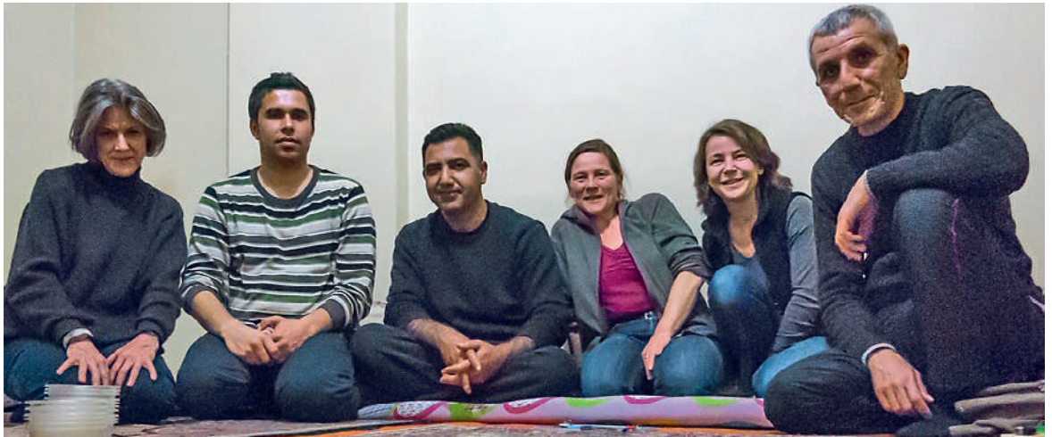
Lächeln trotz lebensbedrohlicher Arbeitsbedingungen inmitten grossen Leids: Ärzte aus Kobanê.

mit einem Abklärungsauftrag für medico international Schweiz (ehemals Centrale Sanitaire Suisse) einer kleinen NGO, die während des spanischen Bürgerkriegs gegründet wurde.