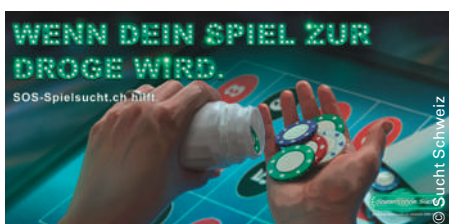
Etwa 28000 Personen in der Schweiz gelten als glücksspielsüchtig.

Mitte Juni lancierten zehn Deutschschweizer Kantone eine Sensibilisierungskampagne zu den Risiken des Glücksspiels. Mit Plakaten, Bierdeckeln und Postern, über den Jugendsen-