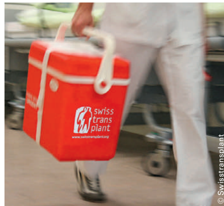
Das Ziel der Kampagne: 20 postmortale Spender pro Million Einwohner.