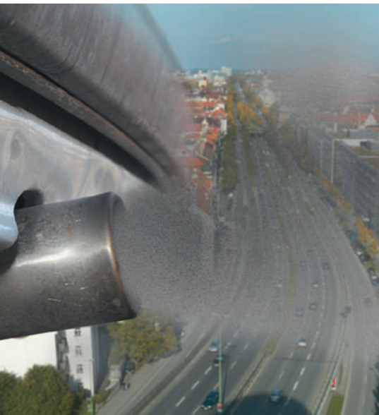
Les particules fines facilitent la pénétration d'agents pathogènes dans les poumons.