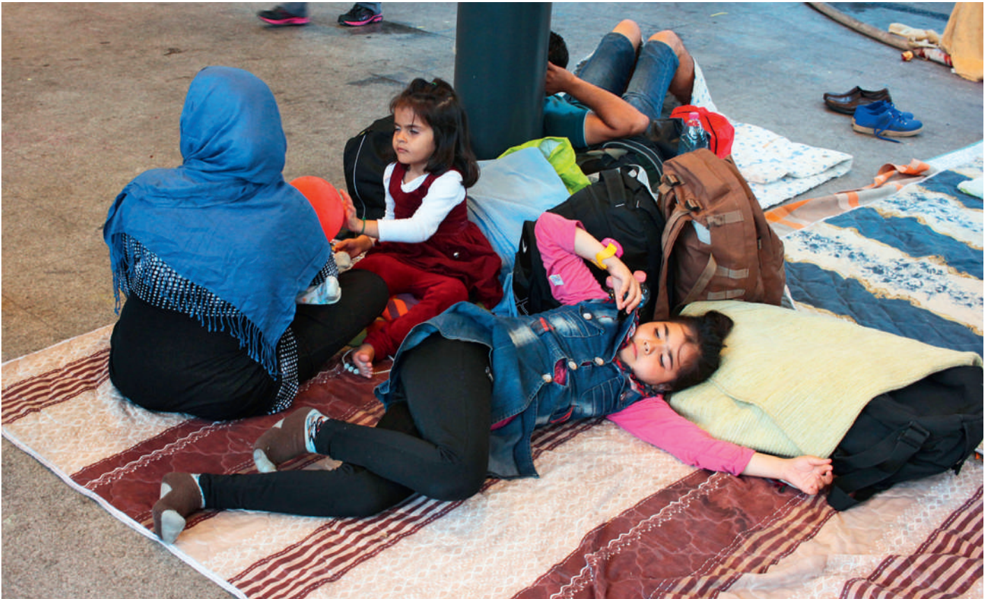
Les réfugiés ont des besoins sanitaires spécifiques nécessitant une réponse «généraliste» interdisciplinaire.