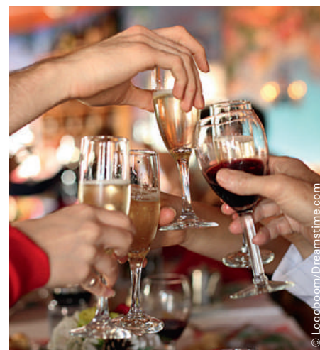
Trop méconnu: presque 30% des décès liés à l'alcool sont à mettre au compte de différents cancers.