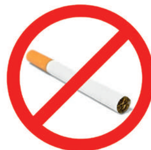
Das Rauchverbot im öffentlichen Verkehr verbesserte die Gesundheit der Bevölkerung spürbar.