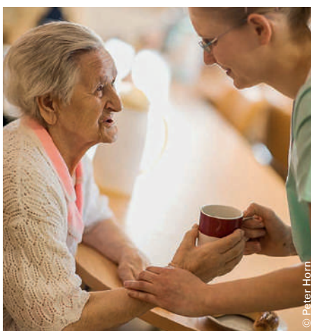
La prise en charge des personnes âgées a considérablement évolué.