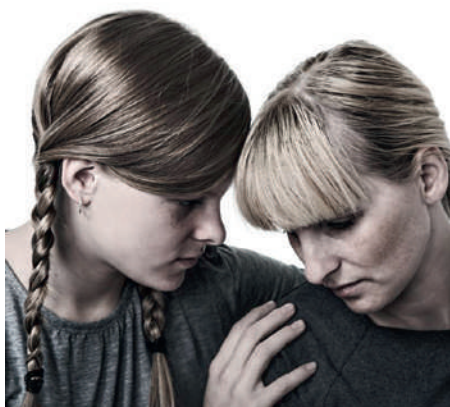
Neuaufgabe: Pro Juventute hat die Kindergeschichten zur Erklärung von Erkrankungen Erwachsener neu herausgegeben.