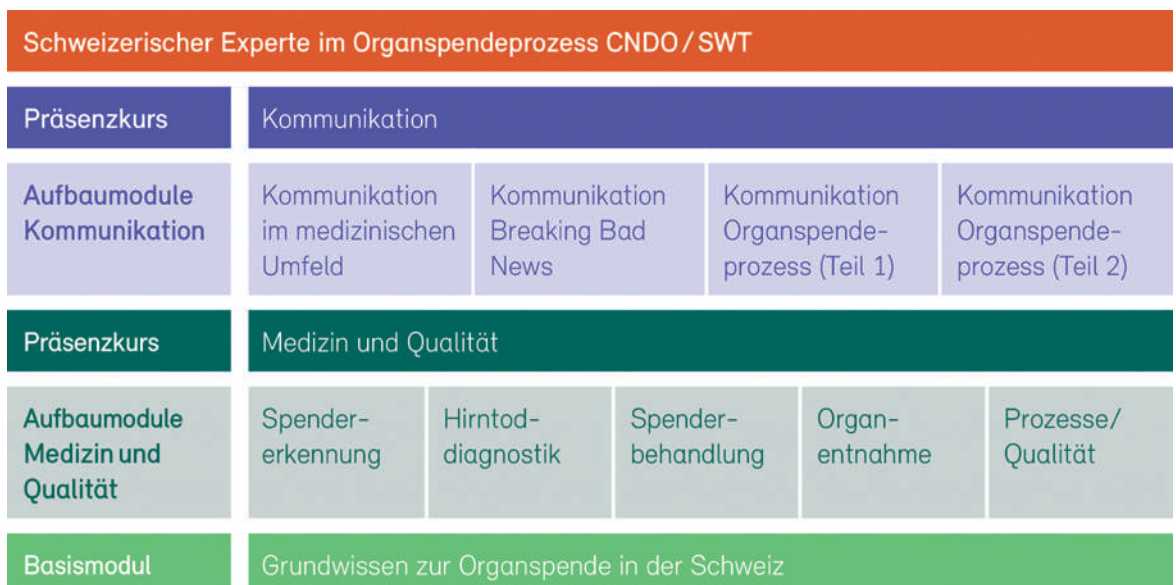
Abbildung 2: Aufbau des Blended Learning zum Organspendeprozess.

litätskontrolle und sollen in der regionalen Landessprache verfügbar sein. Ort, Zeit und Dauer der Ausbildung müssen flexibel sein. Die Absolventen sollen in ihrem eigenen Tempo lernen und die Schwerpunkte ihres Trainings selber festlegen können. Ausserdem sollen der Austausch untereinander gefördert und schliesslich auch die praktischen Fähigkeiten trainiert werden. Diese vielseitigen Anforderungen erfüllt ein Blended Learning zurzeit am besten: Dabei werden die benötigten Inhalte auf einer digitalen Lernplattform zur Verfügung gestellt und mit Präsenzkursen ergänzt. Der neue Lehrgang OSP kombiniert zehn Module online-basiertes Selbststudium mit zwei Präsenzkursen zu den Schwerpunkten «Medizin» und «Kommunikation» (Abb. 2).