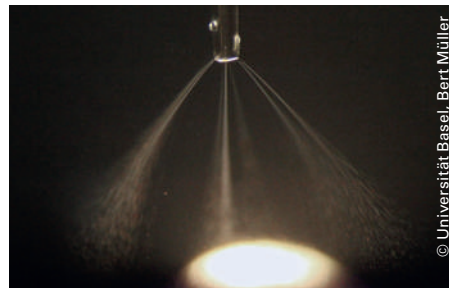
Elektrisch erzeugter Spray für die Herstellung ultradünner Silikonschichten.

Forscher der Universität Basel sind gemeinsam mit der Empa der Entwicklung künstlicher Muskeln einen Schritt näher gekommen: Sie haben eine Methode entwickelt, um nanometerdünne Silikonschichten zu erzeugen. Dazu zerstäuben die Forscher die Silikonmoleküle in Lösung mit Hilfe einer Hochspannung, der sogenannten Elektrospray-Technologie. Normalerweise funktioniert der Elektrospray mit Gleichstrom. Für die Entwicklung künstlicher Muskeln experimentieren die Basler Wissenschaftler mit einer Wechselstrom-Methode. Sie wiesen nach, dass diese vergleichsweise simple und im Industrieumfeld geeignete Methode riesiges Potential für die Herstellung künstlicher Muskeln hat. So könnte man solche Muskeln z.B. für den Antrieb von Scheibenwischern einsetzen.