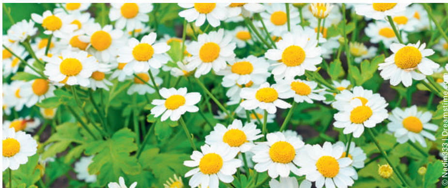
Lässt geschädigte Nervenfasern schneller nachwachsen: im «Mutterkraut» enthaltenes Parthenolide.