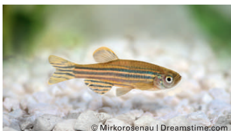
Le stress peut affecter la faculté de guérison des poissons zèbres.