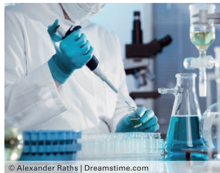
Dans la lutte contre le lymphome, il y a de l'espoir: les chercheurs utilisent un anticorps capable de neutraliser une protéine spécifique afin de bloquer la migration de ces cellules néfastes et empêcher le développement de la maladie. (image symbole)