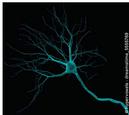
Prion-Proteine haben eine wichtige Aufgabe: Sie tragen dazu bei, dass die Schwann-Zellen um die empfindlichen Nervenfasern herum die schützende elektrische Isolationsschicht bilden.