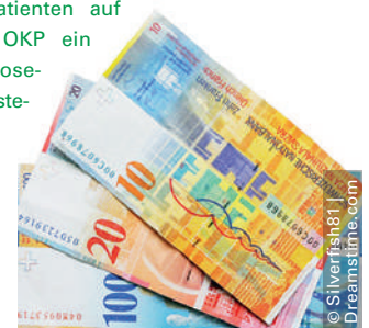
Ab August vergütet die obligatorische Krankenpflegeversicherung unter anderem neue Behandlungsmethoden gegen Komplikationen nach einer Lungentransplantation.