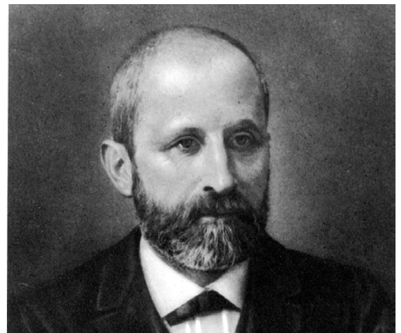
Friedrich Miescher (1844–1895).

Friedrich Miescher ist heute nicht für seine höhenphysiologischen Forschungen bekannt, sondern gilt als wichtiger Wegbereiter der Molekularbiologie und als Pionier bei der Entdeckung der Desoxyribonukleinsäure (DNA). Nach der Promotion an der Universität Basel im Jahr 1868 arbeitete Miescher bei Felix Hoppe-Seyler, einem Begründer der physiologischen Chemie, in Tübingen. In dessen Labor, das in der ehemaligen Küche des Tübinger Schlosses untergebracht war, unter-