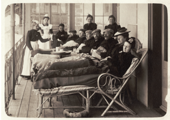
Liegekur in Davos (um 1900).

Höhenklimas auf die Lungentuberkulose – die damals häufigste krankheitsbedingte Todesursache – erschien im Dezember 1893 im Correspondenz-Blatt für Schweizer Aerzte . Der Text basierte auf dem Manuskript eines Vortrags, den Miescher zuvor an der Versammlung des Zentralvereins Schweizer Ärzte in Olten gehalten hatte. Bei der Lektüre von Mieschers Text wird deutlich, dass er von einer heilenden Wirkung des Höhenklimas ausging, etwa wenn er von der «bekannten hygienischen und therapeutischen Wirkung des Höhenklimas» sprach. Miescher wollte theoretisch darlegen, wie der Körper in der Höhe von Schweizer Kurorten wie Arosa oder Davos auf einen geringeren Luftdruck reagierte und wie es im Blut zu einer in seinen Augen heilsamen Kompensationswirkung kam. Er argumentierte dabei wohl durchaus auch aufgrund eigener Betroffenheit: Miescher begab sich nur wenige Monate nach seinem Vortrag in stationäre Behandlung nach Davos, wo er Heilung suchte. Das Thema der Höhenphysiologie war ihm denn auch überaus wichtig. Sein Mitarbeiter Alfred Jaquet schrieb im Rückblick über die Zeit, in der Miescher bereits im Davoser Sanatorium lag: «In allen seinen Briefen erwähnte er [Miescher] die Frage des Höhenklimas und sprach wiederholt den Wunsch aus, dass diese unter seiner Leitung begonnenen Unternehmungen auch in seiner Abwesenheit fortgesetzt werden möchten.»