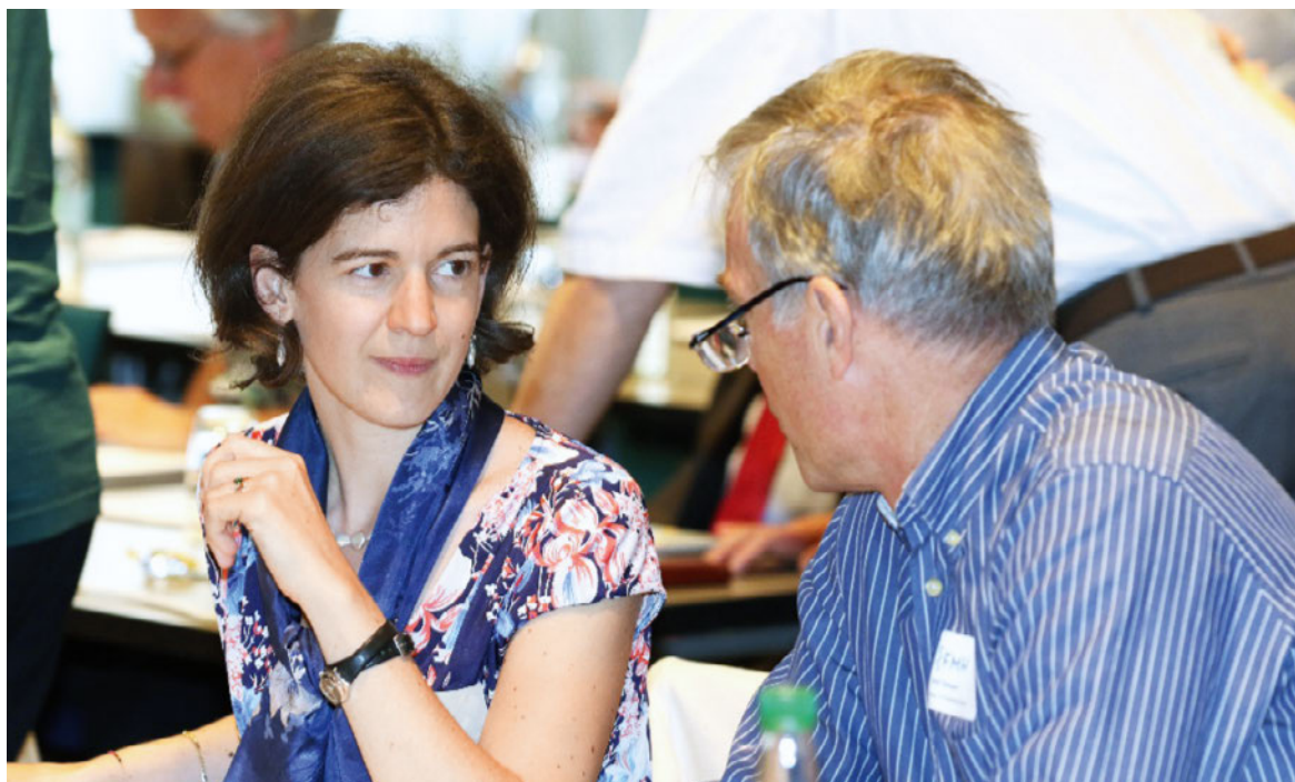
Les exposés ont suscité un vif intérêt de la part des participants à la Journée des délégués tarifaires.

Pour ce faire, le modèle de coûts KOREG est actuellement mis à jour en collaboration avec la Caisse des médecins. Dès que les taux de coûts INFRA définitifs auront été calculés, ils seront communiqués aux sociétés de discipline concernées.