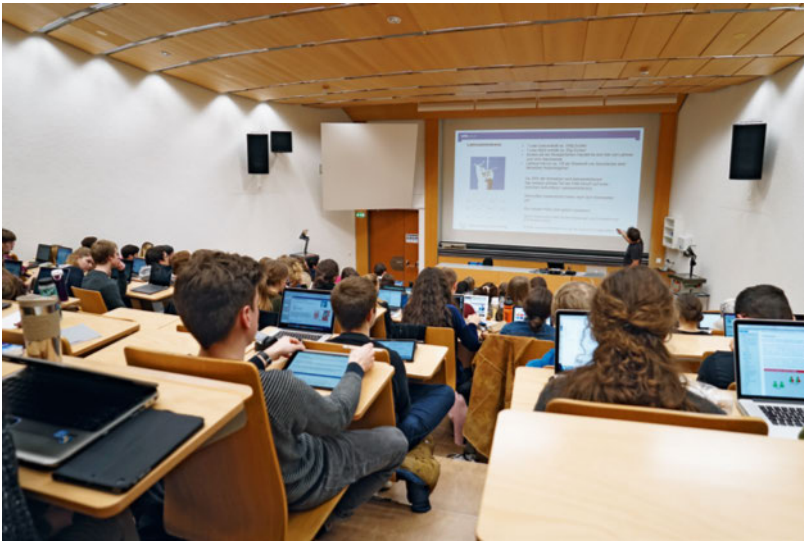
Die ETH Zürich bietet seit Herbst 2017 einen Bachelorstudiengang in Medizin an.

nennen, ist so aufgebaut, dass deren Studierende für ein Masterstudium im Tessin, in Basel und Zürich vorbereitet sind.