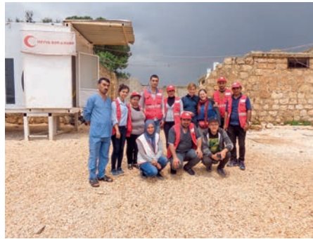
Ein Gesundheitsposten von Heyva Sor a kurd.