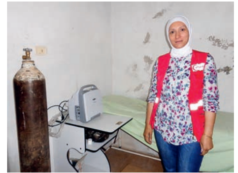
Die Leiterin von Heyva Sor a kurd in Shehba.

Gynäkologin zur Verfügung. Wir diskutieren mit unserer Partnerorganisation deshalb auch die Ausbildung von Gesundheitspromotorinnen nach dem Vorbild von Zentralamerika. Denn inzwischen genießt medico international schweiz das Vertrauen diverser kurdischer Organisationen aus dem Gesundheitsbereich, aber auch kurdischer Frauenorganisationen.