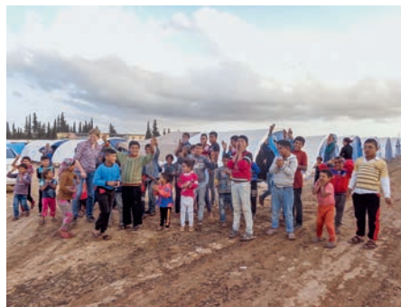
Fotoshooting – eine willkommene Abwechslung für die Kinder im Camp.