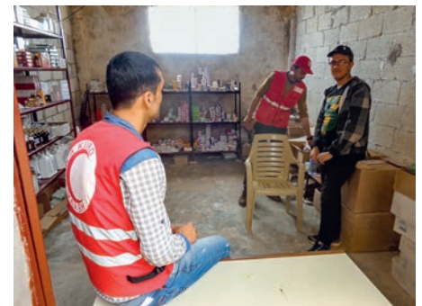
Ein Blick in die Apotheke.