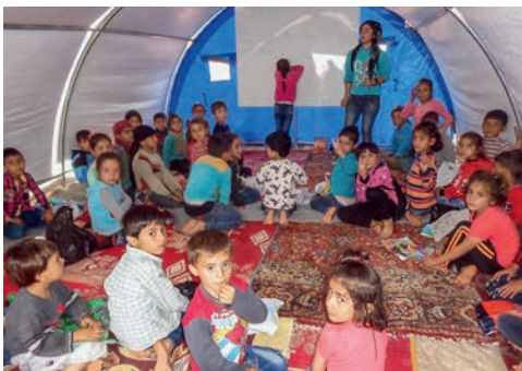
Schulunterricht im Flüchtlingscamp.