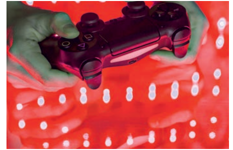
Gaming Disorder ist eine durch die WHO anerkannte Krankheit

(APVAC1), die auf die nicht-mutierten, aber von den Tumorzellen stark überexprimierten Antigene ausgerichtet ist, gefolgt von einer Impfung APVAC2, die vorzugsweise auf die Neoantigene gerichtet ist. Die Zusammensetzung der Impfstoffe erfolgte für jeden Patienten nach einer Analyse des Genoms (dem «Personalausweis») und der Peptide (dem «digitalen Fingerabdruck») seiner Tumoren personalisiert. Bei keinem der Patienten trat eine unerwünschte Nebenwirkung auf. Die beiden Impfstofftypen riefen eine so starke Immunreaktion hervor, wie sie im Zusammenhang mit Gehirntumoren bisher noch nie beobachtet wurde. (Hôpitaux Universitaires Genève HUG)