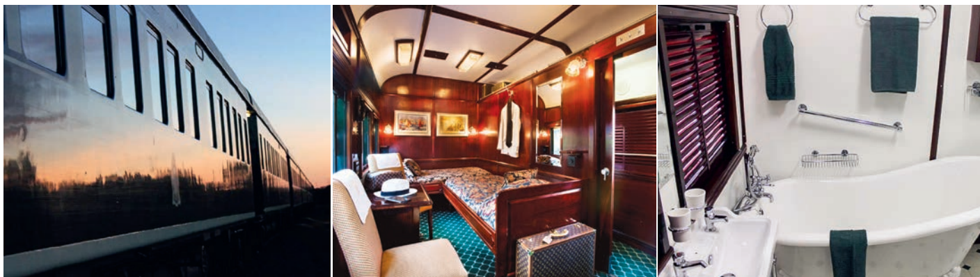
Rovos Rail bietet Luxuszugreisen durch Südafrika und darüber hinaus an. Beispielsweise werden regelmässig die Victoriafälle in Simbabwe angefahren. Auf den Fotos in der Mitte und rechts ist eine Kabine mit Bad zu sehen, wie sie auch dem Zugarzt zur Verfügung steht.