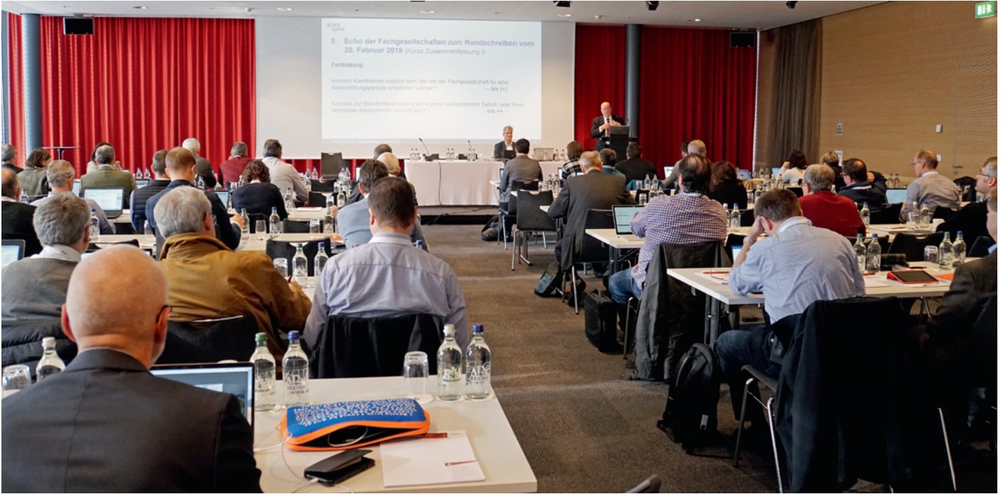
L'assemblée plénière de l'ISFM: une journée intense pour développer la qualité de la formation médicale postgraduée et continue. (fh)