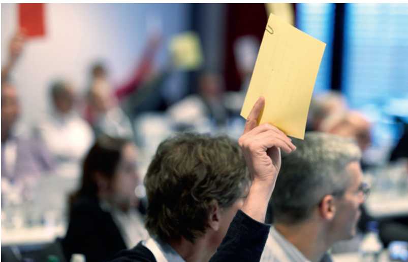
L'assemblée plénière approuve à l'unanimité la précision apportée à la Réglementation pour la formation continue. (yk)