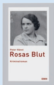
Rosas Blut von Peter Hänni