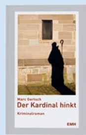
Der Kardinal hinkt von Marc Gertsch